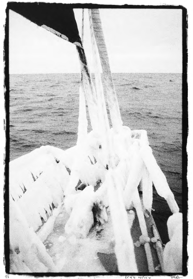
Jour 23 Tirage argentique sur papier baryté, monté sur dibond 53,5 x 38 cm Série de 5 Prix 360.-